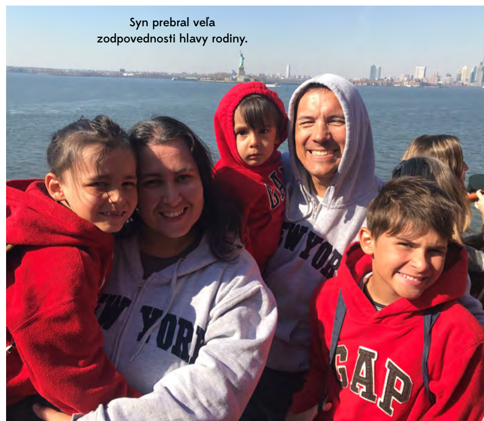
Syn prebral veľa zodpovednosti hlavy rodiny.

Situácia je však tak trochu patová. Jedna učiteľka v „štandardnej“ škôlke má na starosti neraz aj dvadsaťštyri detí a pochopiteľne nemá čas či energiu počúvať názor každého jedného dieťaťa. A jej pozornosť beztak zoberú tie deti, ktoré „sa nevedia správať“ a upozorňujú tak na to, že ich potreby nie sú naplnené. Pravidlá sú nastavené plošne bez ohľadu na osobitosti každého dieťaťa a často nedávajú zmysel. Krásnym príkladom je stravovanie. Tak ako aj v ostatných štátnych zariadeniach, aj v škôlke mojej dcéry deti takmer každý deň desiatujú a olovrantujú chlieb, pretože štátne osnovy tak nariaďujú. Len chlieb, chlieb, chlieb, vlasy vám môžu dupkom vstávať. Na našom rodičovskom združení istý otecko prosil pani riaditeľku, či by mohol jeho syn namiesto šunkovej peny desiatovať niečo iné, lebo ak je natretá na chlebe, on ten chlieb potom nezje a ostane hladný. Po zápornom >>