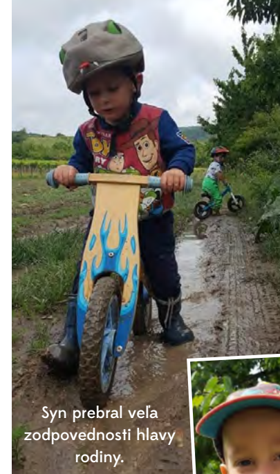
Syn prebral veľa zodpovednosti hlavy rodiny.