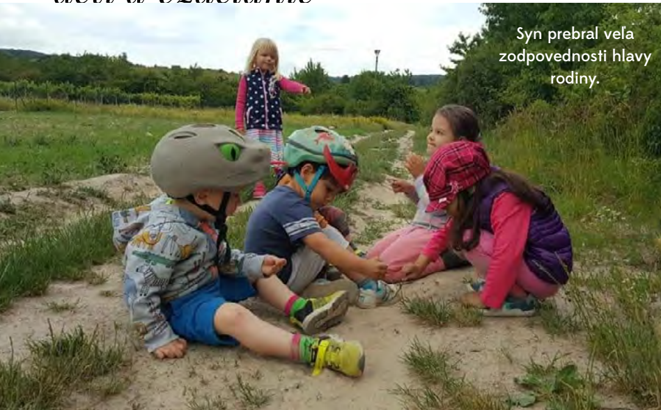
Syn prebral veľa zodpovednosti hlavy rodiny.

pokrútení hláv zo strany pedagogického zboru otecko iniciatívne navrhol, či by tú nátierku teda mohli jeho synovi aspoň naservírovať zvlášť do mištičky, že on by aspoň ten suchý krajec chleba zjedol, lepšie ako nič. Mali ste vidieť ten pohľad plný zdesenia, bezradnosti i zúfalstva a opätovné dôrazné nie. Nie, nemôžu mu to tak v jedálni naservírovať, bohužiaľ, pretože keby zavítala kontrola z hygieny, vedúca jedálne by mohla dostať masťnú pokutu za to, že to nie je tak, ako je predpísané. Oni by aj rady, chápu to... ale veď viete... predpisy. Úrad verejného zdravotníctva to, skrátka, takto nastavil z hľadiska bezpečnosti (hoci nie logiky). Predpísaná porcia, predpísaná gramáž, predpísané servírovanie na kilometre vzdialené od reality. Žiadne vybočenie, žiadna pružnosť. A pritom chápem aj vedúcu jedálne, ktorá musí kúziť jedálne lístky na základe mizerného rozpočtu a podľa noriem ešte z čias Gustáva Husáka. No jednoducho začarovaný kruh, ktorý je nepríjemný aj samotnému celému personálu škôlok a najviac ním utrpí, áno, zase dieťa.